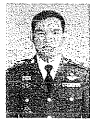
พล.ต.ต.ฉลองเกียรติ ไร่จอนปัญญาคุมป์